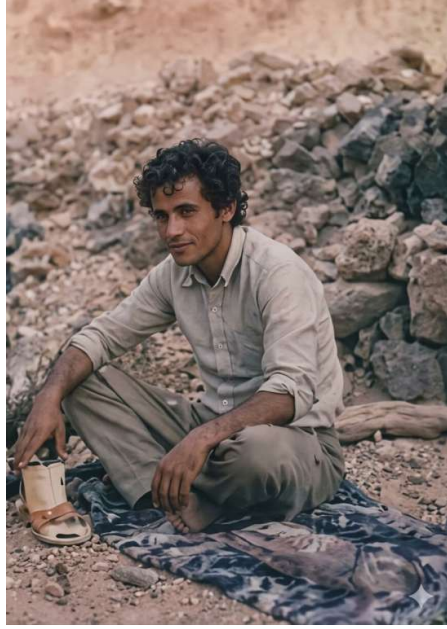
الشهيد أبو الوسن

أي هول أخذهُ في لحظته الأخيرة قبيل خلوده إلى الصمت واقفاً على الرأس راثياً العالم مقلوباً. أستعيد الآن هذا المشهد الفاجع الفريد، جلوسي للحظات منهاراً جوار الجثة الواقعة بالمقلوب.. حملتي الشاردة بقسماتها المحتقنة، وإنهمار تفاصيل علاقتي معه منذ حلولي في - زبوة - وحتى إبابه.. كان الوحيد الذي ينطبق